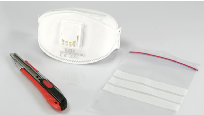
Material für Probenahme bei Fensterkitt und Bodenbelag aus Kunststoff